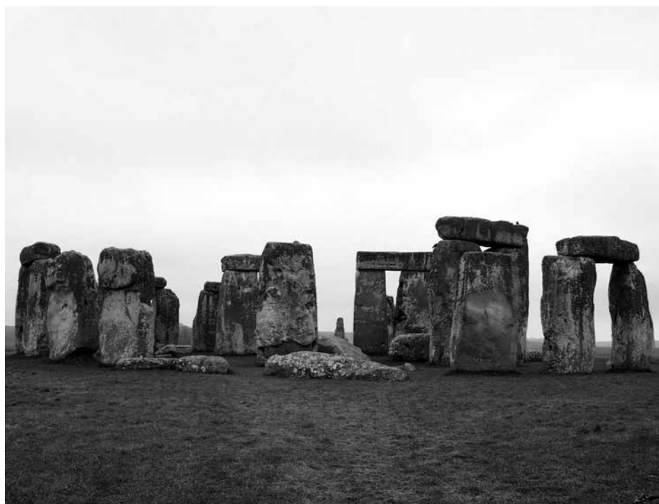
英格蘭中部索爾茲伯里平原上的巨石群