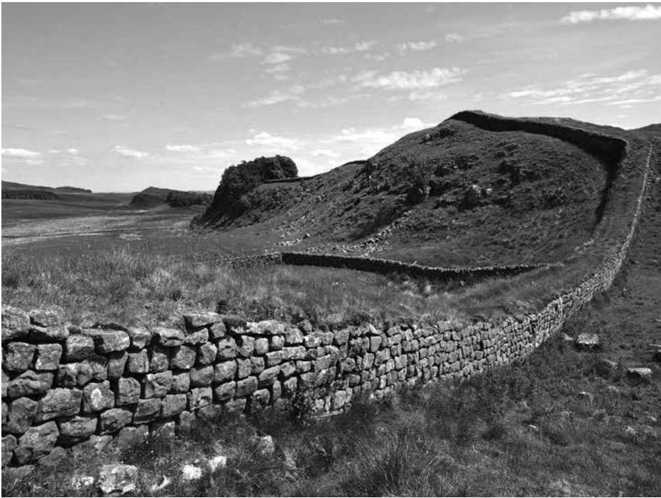
羅馬人在不列顛修建的哈德良長城遺址