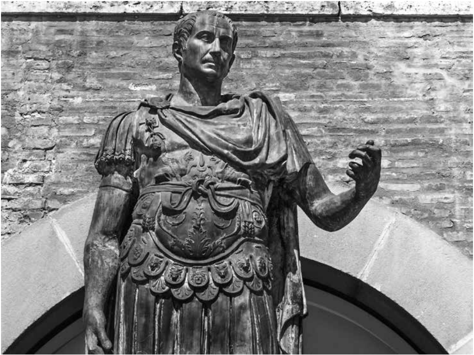
凱撒 (Gaius Julius Caesar, 公元前 100 年—前 44 年), 史稱凱撒大帝, 羅馬共和國末期的軍事統帥、政治家, 羅馬帝國的奠基者