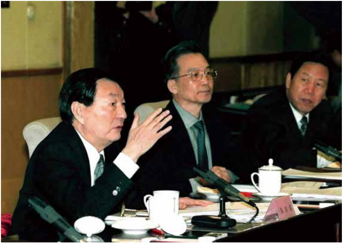
2001年1月14日，全國銀行、證券、保險工作座談會在北京中南海舉行。朱鎔基總理出席座談會並發表重要講話。