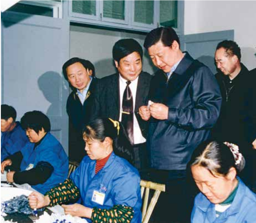
2003年4月10日，習近平在考察杭州市桐廬縣塊狀經濟時參觀分水鎮圓珠筆廠